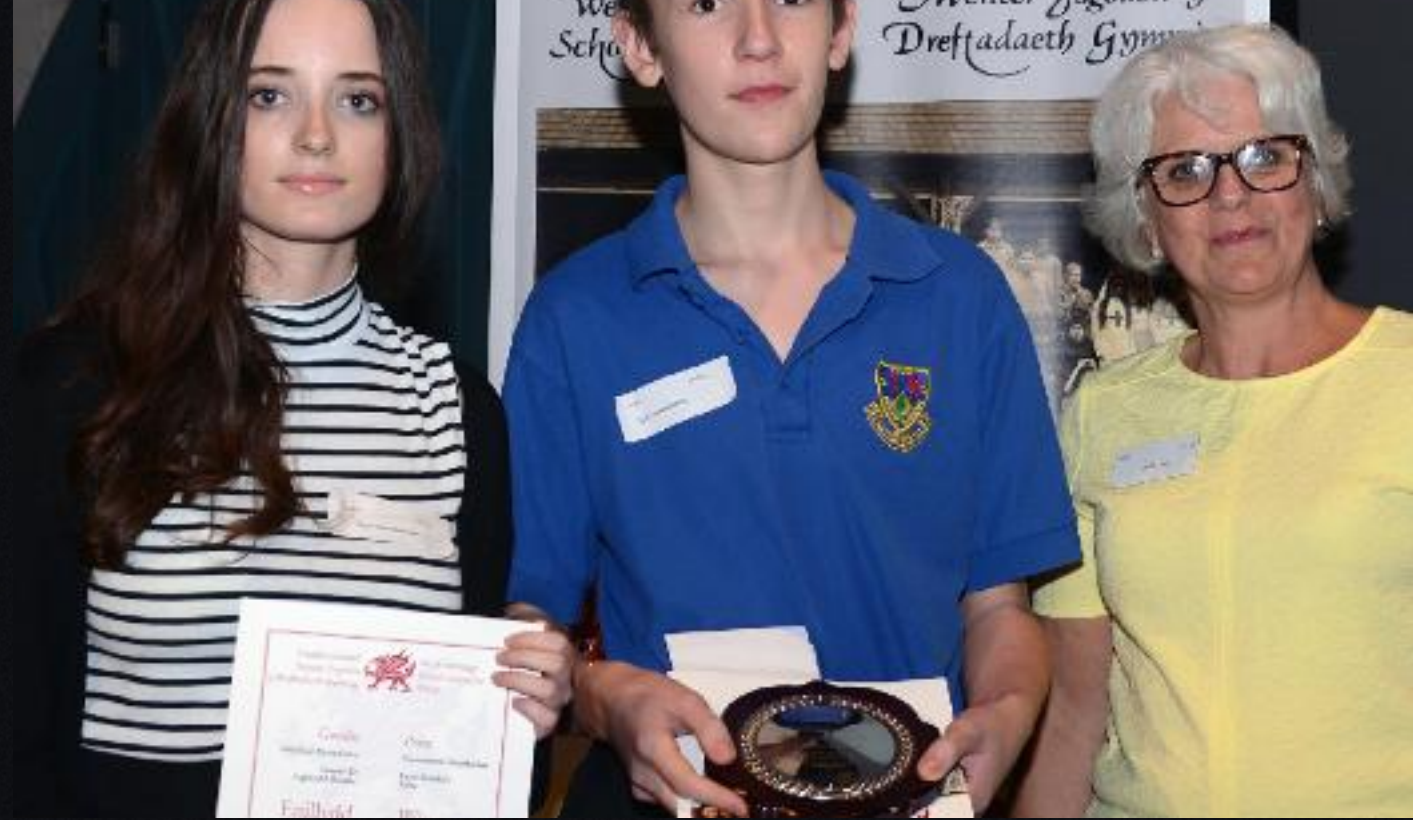
YSGOL MAESYDDERWEN, YSTRADGYNLAIS